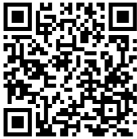
Фото и видео доступны по ссылке: cloud.mail.ru/public/vBHB/aBVMTotXM